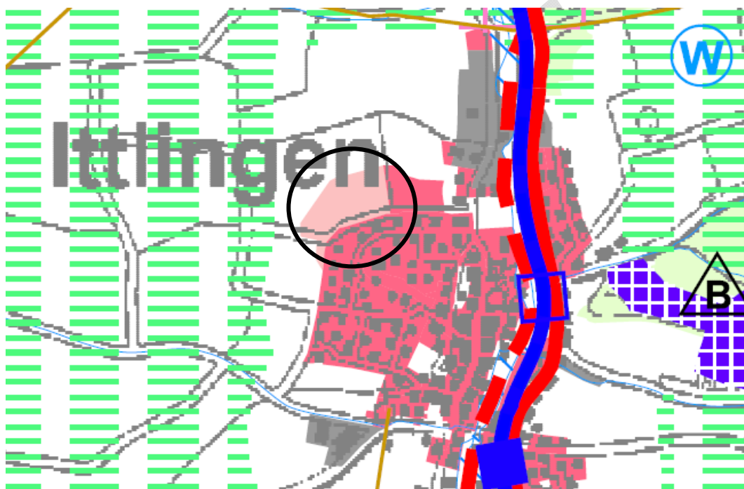
Abb.: Auszug aus Raumnutzungskarte des Regionalplans Heilbronn-Franken 2020

Das Plangebiet ist im Regionalplan innerhalb der Siedlungsstruktur der Gemeinde Ittlingen als geplante Siedlungsfläche Wohnen dargestellt. Damit existieren keine Konflikte mit raumordnerischen Zielen.